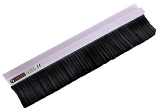
PASSIVE Static Neutralisation Désélectriseurs INDUCTIFS PASSIVE Ionisatoren