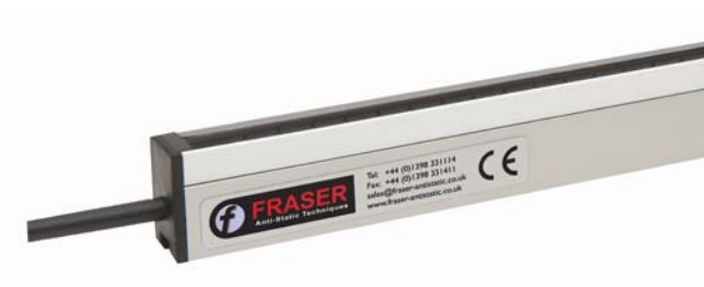
SHORT RANGE Static Neutralisation Neutralisation statique COURTE DISTANCE Statikneutralisierung auf KURZE ENTFERNUNG