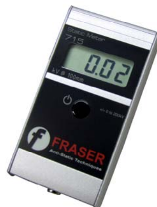
MEASURING MESURE MESSUNG