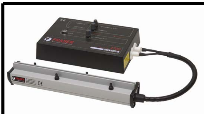
LONG RANGE Static Neutralisation Neutralisation statique LONGUE DISTANCE Statikneutralisierung auf GROSSE ENTFERNUNG

Das Produktprogramm von Fraser umfasst folgende Geräte: