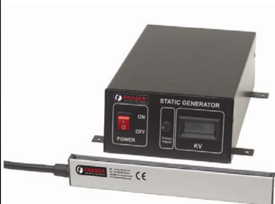
STATIC GENERATION GÉNÉRATION D'ÉLECTRICITÉ STATIQUE STATIKERZEUGUNG