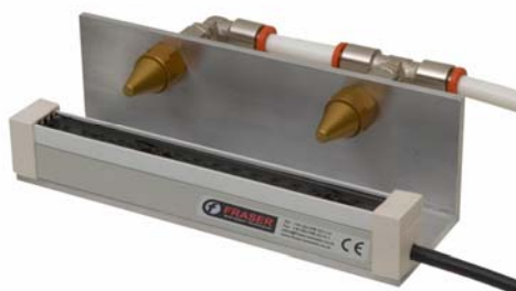
DUST REMOVAL and CLEANING ÉLIMINATION DE LA POUSSIÈRE et NETTOYAGE STAUBENTFERNUNG UND REINIGUNG