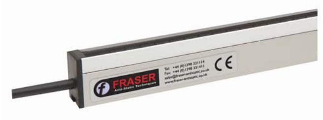
SHORT RANGE Static Neutralisation Neutralisation statique COURTE DISTANCE Statikneutralisierung auf KURZE ENTFERNUNG