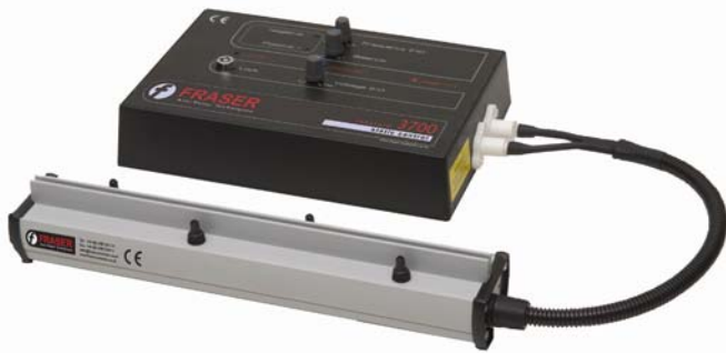
LONG RANGE Static Neutralisation Neutralisation statique LONGUE DISTANCE Statikneutralisierung auf GROSSE ENTFERNUNG

Das Produktprogramm von Fraser umfasst folgende Geräte: