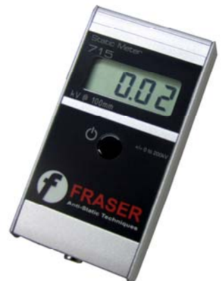
MEASURING MESURE MESSUNG