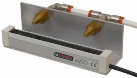
DUST REMOVAL and CLEANING ÉLIMINATION DE LA POUSSIÈRE et NETTOYAGE STAUBENTFERNUNG UND REINIGUNG