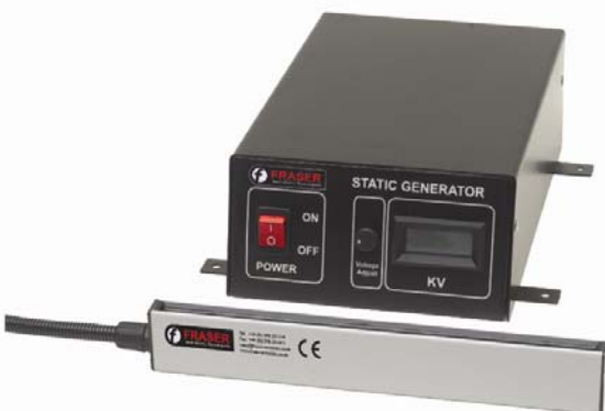
STATIC GENERATION GÉNÉRATION D'ÉLECTRICITÉ STATIQUE STATIKERZEUGUNG